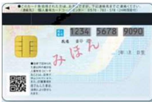
個人番号が記載されている面を上にして、個人番号カード、通知カードについての注意事項が記載されています。